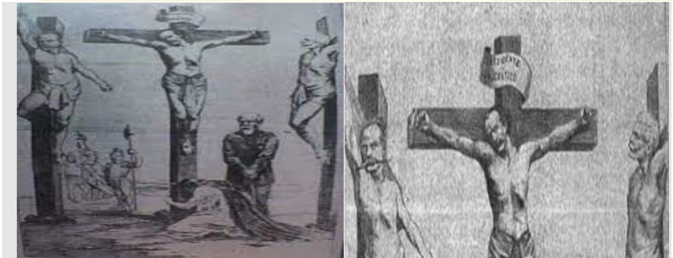
Balmaceda Crucificado, Redentor de Pueblo, Sátira política en Chile (1811-1898)