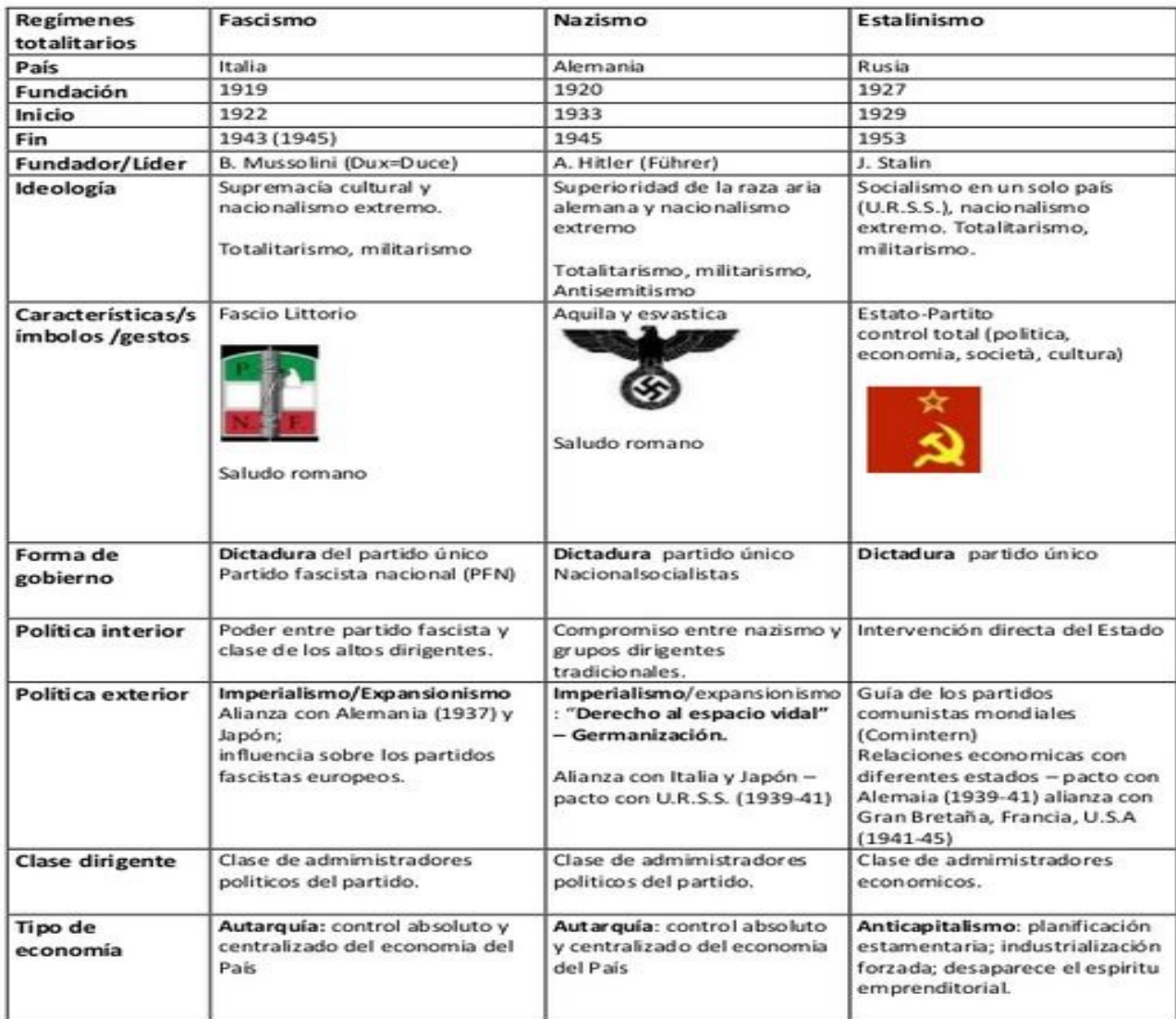
Tabla conclusiva "Regímenes totalitarios dictatoriales en el periodo entreguerras"